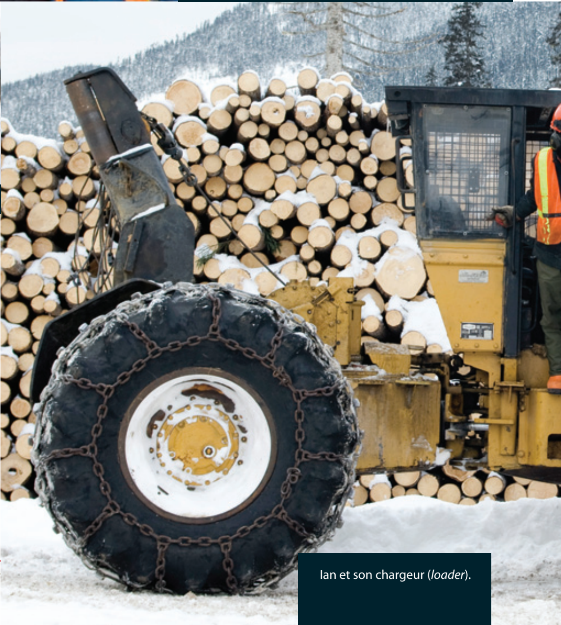
Ian et son chargeur ( loader ).

Elle travaille maintenant pour Produits Forestiers Innus comme chauffeuse d'autobus. Grâce à elle, tous les employés sont assurés de se rendre à bon port !