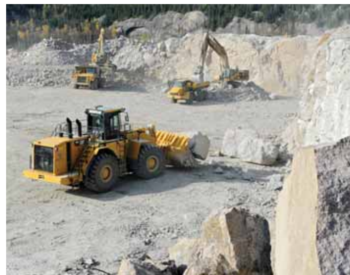
Transport du roc.

Bref, autour de la rivière Romaine, c'est une véritable fourmilière. Si vous voulez en savoir plus sur ces travaux, nous vous invitons à tourner la page !