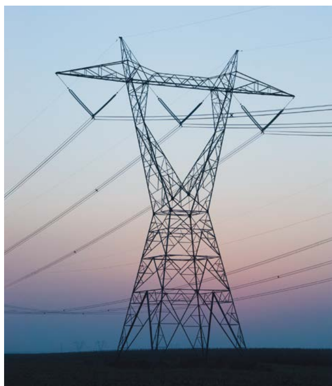
Pylône type d'une ligne à 735 kV